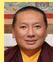
Zurmang Gharwang Rinpoche