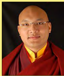
Seine Heiligkeit der 17. Karmapa Ogyen Trinley Dorje

Als spirituelles Oberhaupt der 900 Jahre alten Karma-Kagyü-Linie des tibetischen Buddhismus ist S.H. Karmapa einer der bedeutendsten geistigen Lehrer unserer Zeit. Seit seiner Flucht von Tibet nach Indien im Jahr 2000 ist er eine wichtige Schlüsselfigur im Erhalt der tibetischen Religion und Kultur. Neben den Aktivitäten als Lehrer beschäftigt sich er sich mit den gewaltigen Herausforderungen, die die heutige Welt mit sich bringt - beispielsweise in geschlechterfragen, in Fragen der Gerechtigkeit in der Lebensmittelindustrie, dem ausufernden Konsum und der aktuellen weltweisen Umweltkrisen.