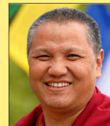
Sangye Nyenpa Rinpoche