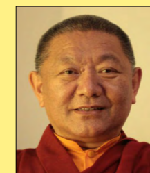
Ringu Tulku Rinpoche