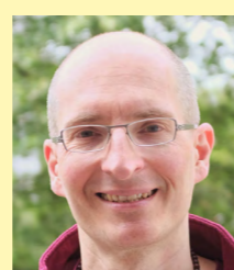
Lama Yeshe Gyamtso