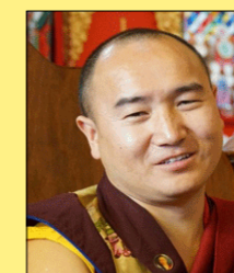
Lama Damchö Rinpoche