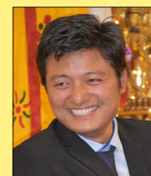
Do Tulku Rinpoche